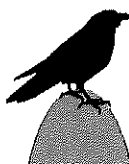
Snorri Sigurðsson Sviðsstjóri náttúruverndar